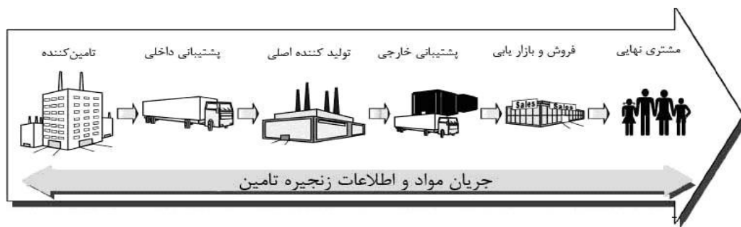
شکل شماره (۱): مدل مفهومی زنجیره تأمین (Asgharizadeh & Ghasemi, 2011)

طراحی و مدیریت زنجیره تأمین، به تولید و تحویل محصولات گوناگون با هزینه پایین، کیفیت بالا و زمان کوتاه تحویل کمک می‌کند. رقابت جهانی فشار زیادی را بر محصول و عرضه دهندگان خدمات تحمیل کرده است تا عملیات و شیوه‌های آن را بهبود دهند. باین‌حال، موفقیت زنجیره تأمین به چگونگی طراحی و اجرای آن، شناسایی ترکیبی مؤثر از تأمین‌کنندگان، تولیدکنندگان، توزیع‌کنندگان و نظارت بر عملکرد زنجیره تأمین بستگی زیادی دارد (Burgess & et al, 2006). مدیریت زنجیره تأمین از جمله مفاهیم استعاره‌ای در عرصه مدیریت است و از این‌رو از دیدگاه‌های مختلف مورد توجه قرار گرفته است. از آن جمله می‌توان به تحلیل فراروش ۲ در این زمینه اشاره کرد (جدول ۱). شرکت‌ها می‌توانند از طریق فناوری اطلاعات به‌طور خودکار جریان محصول و اطلاعات مربوط به ظرفیت تولید، تقاضای مشتری، موجودی در هزینه پایین‌تر را مدیریت کنند. اطلاعات به اشتراک گذاشته شده عملکرد زنجیره تأمین را بهبود می‌بخشد. یکی از چالش‌های مهم شرکت‌های بزرگ چگونگی به‌کارگیری فناوری اطلاعات برای افزایش بهره‌وری زنجیره تأمین است (Russell & Anne, 2007).