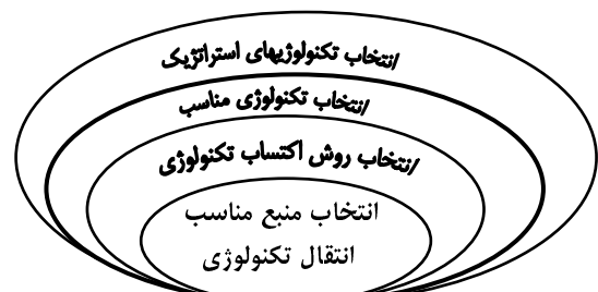
شکل ۱. انتخاب‌های تکنولوژیک یک بنگاه اقتصادی

تکنولوژی مناسب تاثیر قابل توجهی بر موفقیت فعالیت‌های بعدی و اثربخشی بکارگیری تکنولوژی دارد. اهمیت این مسأله تا به حدی است که نه تنها دارای نتایج اقتصادی قابل توجهی است بلکه با توجه به نقش استراتژیک آن در جهان امروز، می‌تواند منجر به شکست یا موفقیت کامل یک بنگاه اقتصادی شود. تصمیم‌گیری در خصوص انتخاب تکنولوژی سطوح متفاوتی دارد که در این راستا می‌توان به انتخاب تکنولوژیهای استراتژیک در سطح بنگاه اشاره کرد. همچنین می‌توان به تصمیم‌گیریهای تاکتیکی نظیر انتخاب تکنولوژی مناسب، انتخاب روش مناسب اکتساب، و انتخاب منبع مناسب انتقال تکنولوژی اشاره داشت (شکل ۱). ارزیابی تکنولوژی در اصل، به دلیل بررسی آثار منفی احتمالی آن دارای اهمیت می‌باشد. بدین صورت که ضمن کاهش پیامدهای منفی تکنولوژی بایستی در اندیشه حد اکثر نمودن آثار مثبت آن و نیز توسعه متناسب با شرایط پیاده‌سازی آن همت ورزید. بنا براین محور ارزیابی می‌تواند بررسی ویژگیهای ذاتی و یا بررسی مشکلات اجتماعی ناشی از کاربرد یک تکنولوژی باشد [۷]. به هر حال، ارزیابی و انتخاب تکنولوژی مناسب تحت تاثیر عواملی نظیر نقطه نظرات تصمیم‌گیرندگان کلیدی، و شرایط ملی و بنگاهی است که ممکن است گزینه‌ها بر اساس برخی شاخص‌ها مطلوب و بر اساس برخی دیگر نامطلوب ارزیابی شوند.