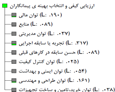
شکل شماره (۱۰) - ساختار درختی وزن معیارها (تصویر از خروجی نرم افزار)

پس از تعیین وزن معیارها، پاسخ نامه ی خبرگان در خصوص زیرمعیارها به مانند آنچه در خصوص معیارها گفته شد، جدول میانگین زیرمعیارهای هر یک از معیارها تهیه می گردد، در شکل ۱۰ و ۱۱ به عنوان نمونه پاسخنامه ی یکی از خبرگان در خصوص زیر معیارهای، معیار حسن سابقه و همچنین جدول محاسبه میانگین امتیازات این زیرمعیارها آورده شده است.