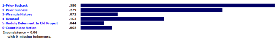
شکل شماره (۱۴): امتیازات زیرمعیارهای معیار حسن سابقه محاسبه شده توسط نرم افزار (تصویر از خروجی نرم افزار)

Priorities with respect to: Goal: Evaluation Contractor EPC >Fame